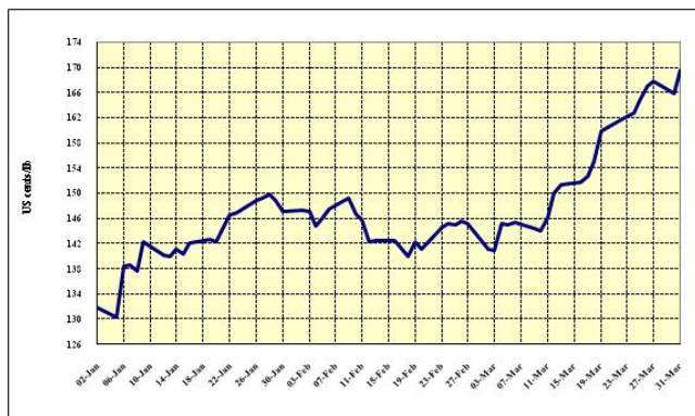
Gráfico 2: Precios indicativos diarios de los Suaves Colombianos 2 enero – 31 marzo 2009