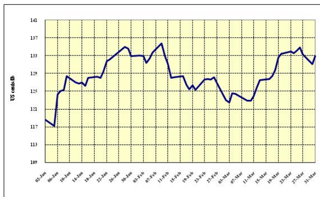
Gráfico 3: Precios indicativos diarios de los Otros Suaves 2 enero – 31 marzo 2009