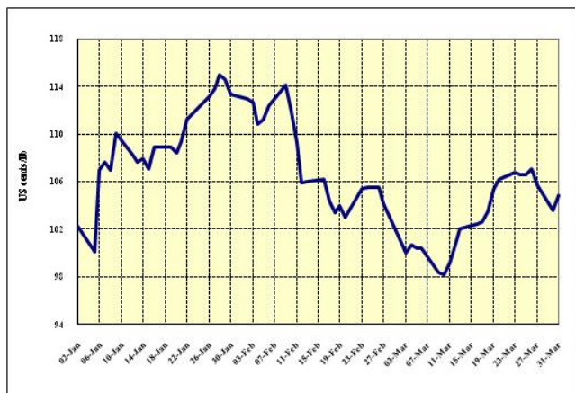
Gráfico 4: Precios indicativos diarios de los Brasil y Otros Naturales 2 enero – 31 marzo 2009