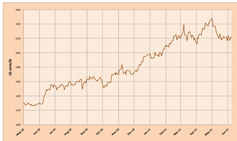
Graphique 1 : Prix indicatif composé quotidien de l'OIC 3 mai 2010 – 10 juin 2011