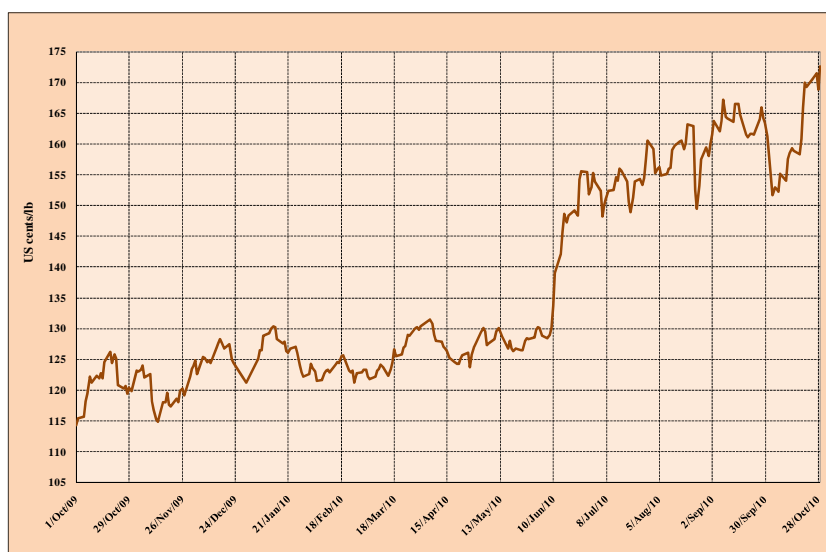
Graphique 1 : Prix indicatif composé quotidien 1 octobre 2009 – 2 novembre 2010