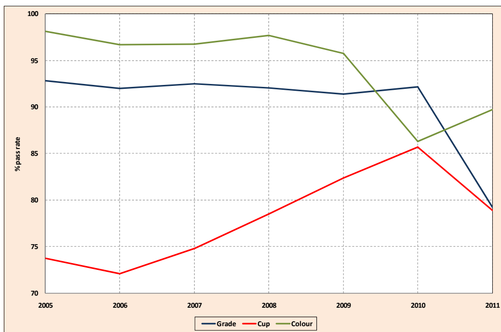
Gráfico 1: Resultados das análises da cor, bebida e classificação da ICE Anos civis de 2005 a 2011

4. Em resumo, o nível geral de aprovação na análise do café do Contrato 'C' da ICE foi de 70% no ano civil de 2011. Essa foi a porcentagem mais baixa registrada desde o estabelecimento do PMQC. Em 2006, o nível geral de aprovação foi de 79,7%.